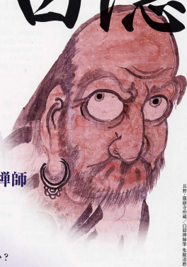
長野 龍聖寺所蔵「白隠禅師坐像」複製