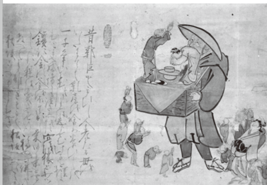
白隠禅師筆 個人蔵「傀儡師(人形遣い)」